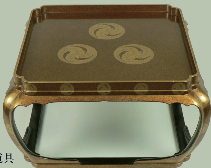
30代当主・英利公のもとに 大久保家から嫁いだ奥方 (大久保教隆娘)の嫁入り道具