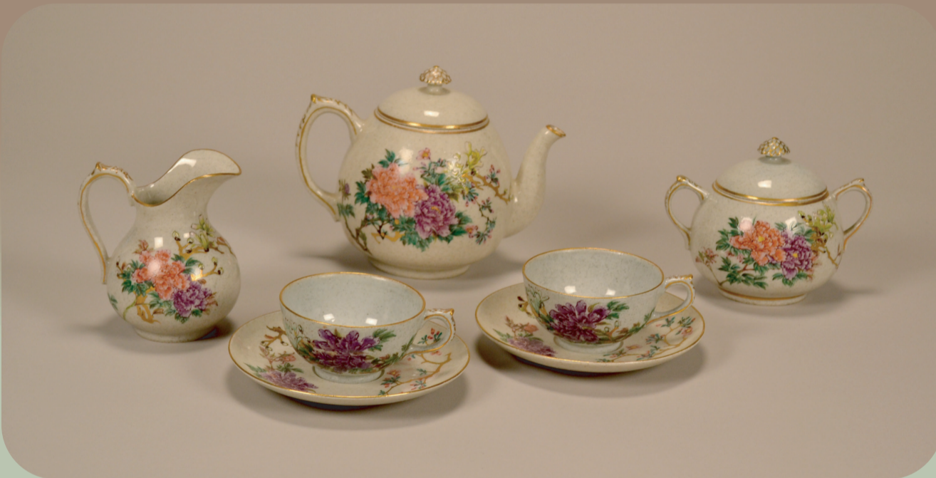
明治6年(1873)開催のウィーン万博へ出陳する作品 として清水六兵衛(京都)が作陶したものうちの 1セット