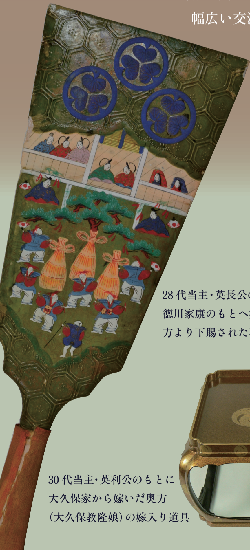
28代当主・英長公の養女として 徳川家康のもとへ嫁いだお万の 方より下賜された羽子板